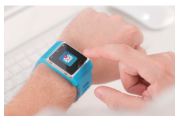
ウェアラブル端末