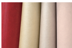
スマートテキスタイル